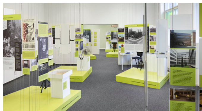
Blick in die Dauerausstellung, Foto: Museum Pankow © Eric Müller