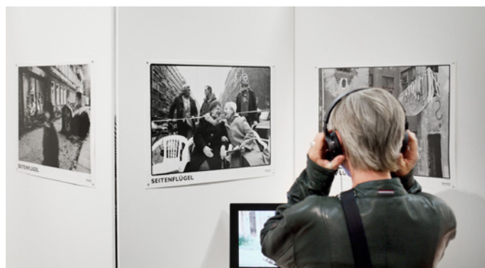
Blick in die Sonderausstellung