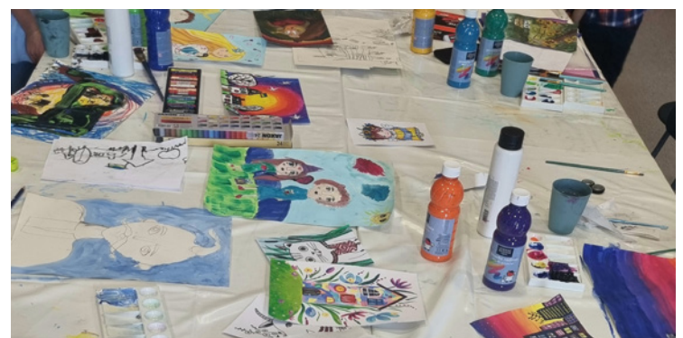
Malkurs für ukrainische Kinder am Nachmittag