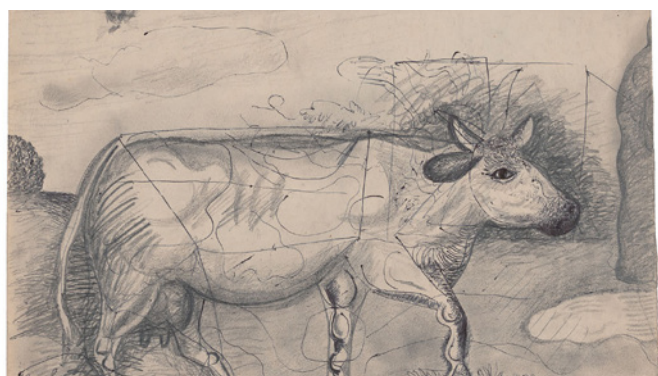
Strawalde: Kuh, 1961, Bleistift, Feder und Tusche auf Papier, 25 x 37 cm (Ausschnitt)