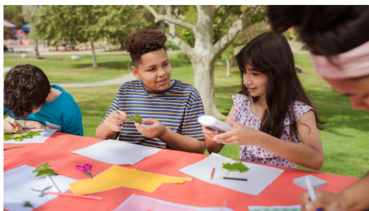
Kinder bei Bastelaktion im Freien

Mehr als 200 Kinder allein aus Riwne haben laut Oleksandr Tretyak, Bürgermeister von Riwne, durch den russischen Angriffskrieg auf die Ukraine einen oder beide Elternteile verloren oder ihre Eltern gelten als vermisst.