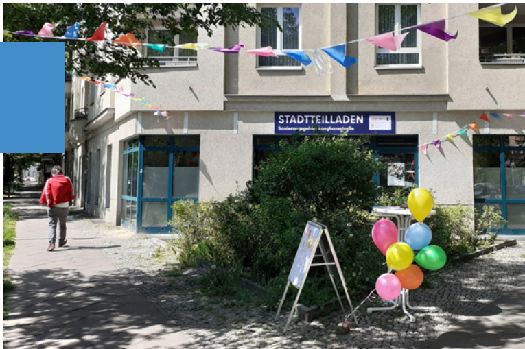
Der Laden befindet sich an der Ecke Jacobsohnstr./Charlottenburger Str., Foto: Stadtkontor

Die Gebietskoordination Stadtkontor GmbH betreibt den Laden im Auftrag des Bezirksamts und bietet jeden Mittwoch zwischen 14 und 18 Uhr eine Sprechzeit an. Auch die gewählte Stadtteilvertretung tagt immer am 3. Mittwoch im