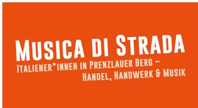
Typografie des Ausstellungstitels

Hier finden Sie eine Auswahl von Ausstellungen in kommunalen Einrichtungen. Der Eintritt ist frei.