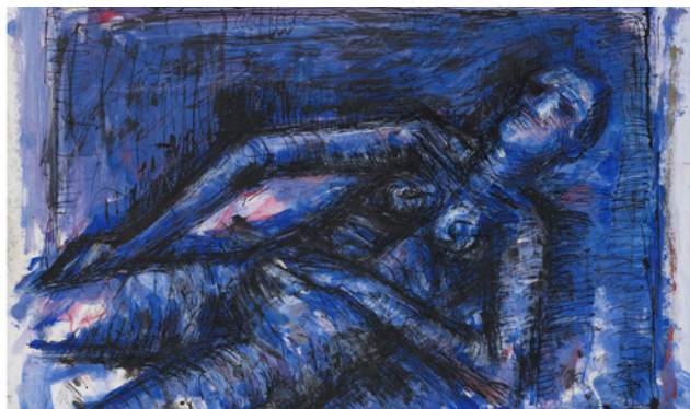
Lothar Böhme, Liegender Akt, ohne Jahr, Mischtechnik auf Papier, 50 x 69,5 cm (Ausschnitt) © Lothar Böhme, Foto: Gunter Lepkowski