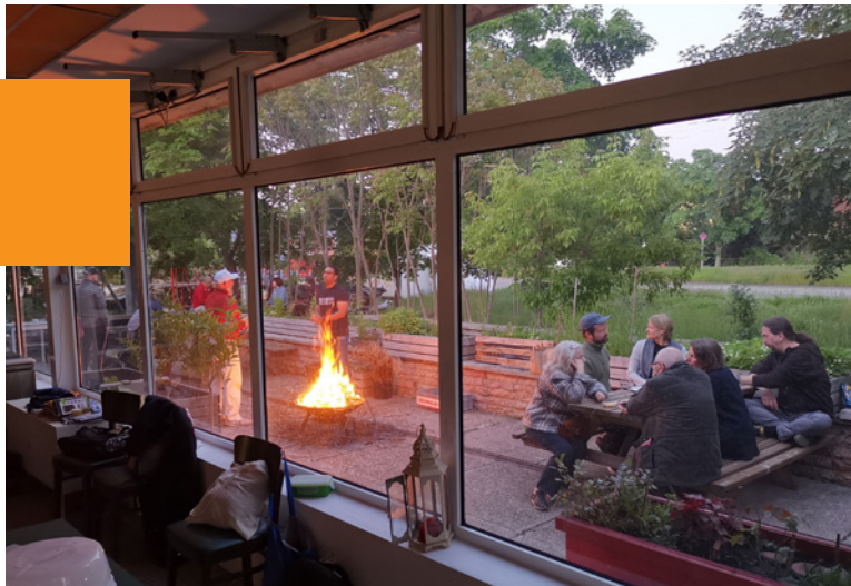
Bei einem Grillabend: Blick aus der Halle auf die Terrasse, Foto: KMH