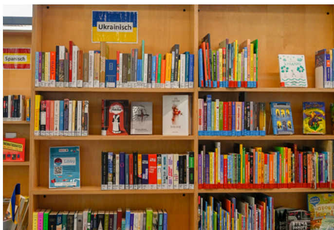
Bücherregal mit ukrainischen Medien in der Bibliothek Karow

Neben dem Medienangebot in Ukrainisch hat sich über die Zeit ein etabliertes Programm entwickelt, zu dem Sprachkurse, ein Sprachcafé, eine Sozialberatung, Kinderfreizeitangebote, aber auch Veranstaltungsreihen gehören. Das Programm richtet sich sowohl an geflüchtete Menschen als auch an alle Karower:innen.