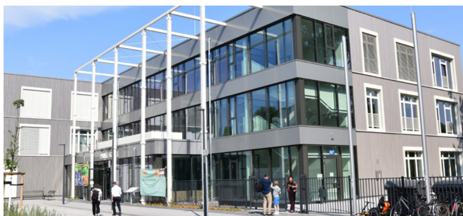
Eingangsbereich der neuen Panke-Schule in der Galenusstraße 64

Der Bau wird nach neusten Nachhaltigkeitsstandards errichtet, u. a. mit Regenwassermanagement, Dachbegrünung und Photovoltaik sowie unter Verwendung nachhaltiger Baustoffe in Verbindung mit einem Recyclingkonzept. Die Gesamtkosten liegen bei ca. 50 Mio. Euro.